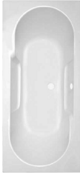
1121 522 BADEWANNE ALTERNA MAREA