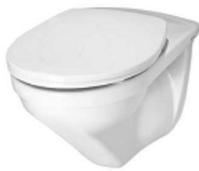
2111 849 WANDKLOSETT MODERNA R - UP