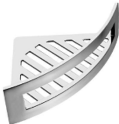
4531 218 DRAHTSEIFENHALTER SAM DUSCHWAY