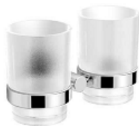
4111 255 DOPPELGLASHALTER ALTERNA TONDA