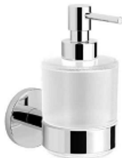
4111 248 SEIFENSPENDER ALTERNA TONDA