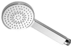
6113 430 HANDBRAUSE KWC AVA