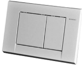
3342 203 ABDECKPLATTE GEBERIT BOLERO