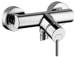
6416 321 DUSCHENMISCHER HANSGROHE