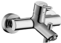
6416 301 BADEMISCHER HANSGROHE