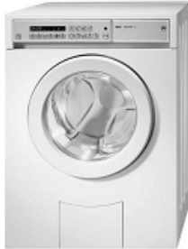
7111 237 WASCHAUTOMAT ZUG ADORA S 266