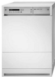
7113 271 WÄSCHETROCKNER ZUG ADORA